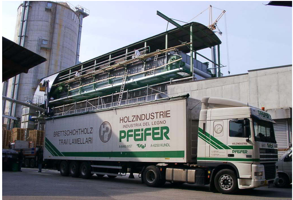
Abbildung 1 Der 2. KUVO Bandrockner bei der Firma Pfeifer in Kundl, aufgebaut über dem ersten Trockner, kurz vor der Fertigstellung

Neben der Pelletpressenstation sind also der Standort, die Rohstofflogistik für die Wärmeerzeugung und die Pelletherzeugung, das Energiekonzept und das richtige Trocknungsverfahren wesentliche Bewertungskriterien zu einer erfolgreichen Holzpelletproduktion.