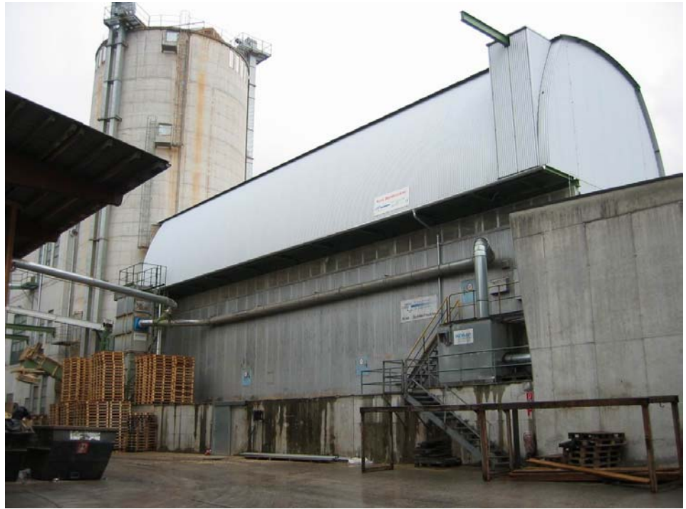
Abbildung 3 Der fertige 2. KUV0-Trockner in Kundl

Bild 4 zeigt eine 3-D Darstellung eines KUV0-Bandrockners mit 2-stufiger Luftaufwärmung. Zuerst wird mit Abwärme aus der Rauchgaskondensation Umgebungsluft vorgewärmt und dann in der zweiten, unteren Stufe mit Kondensationsenergie aus der Stromerzeugung weiter erwärmt. Eine andere Möglichkeit besteht darin, direkt dem Trockner Warmluft, erzeugt mit der Rauchgaskondensation beispielsweise über Platten- oder Glasrohrwärmetauscher zuzuführen und die Warmluft dann mit Heizregistern aus Turbinenabwärme zusätzlich zu erwärmen.